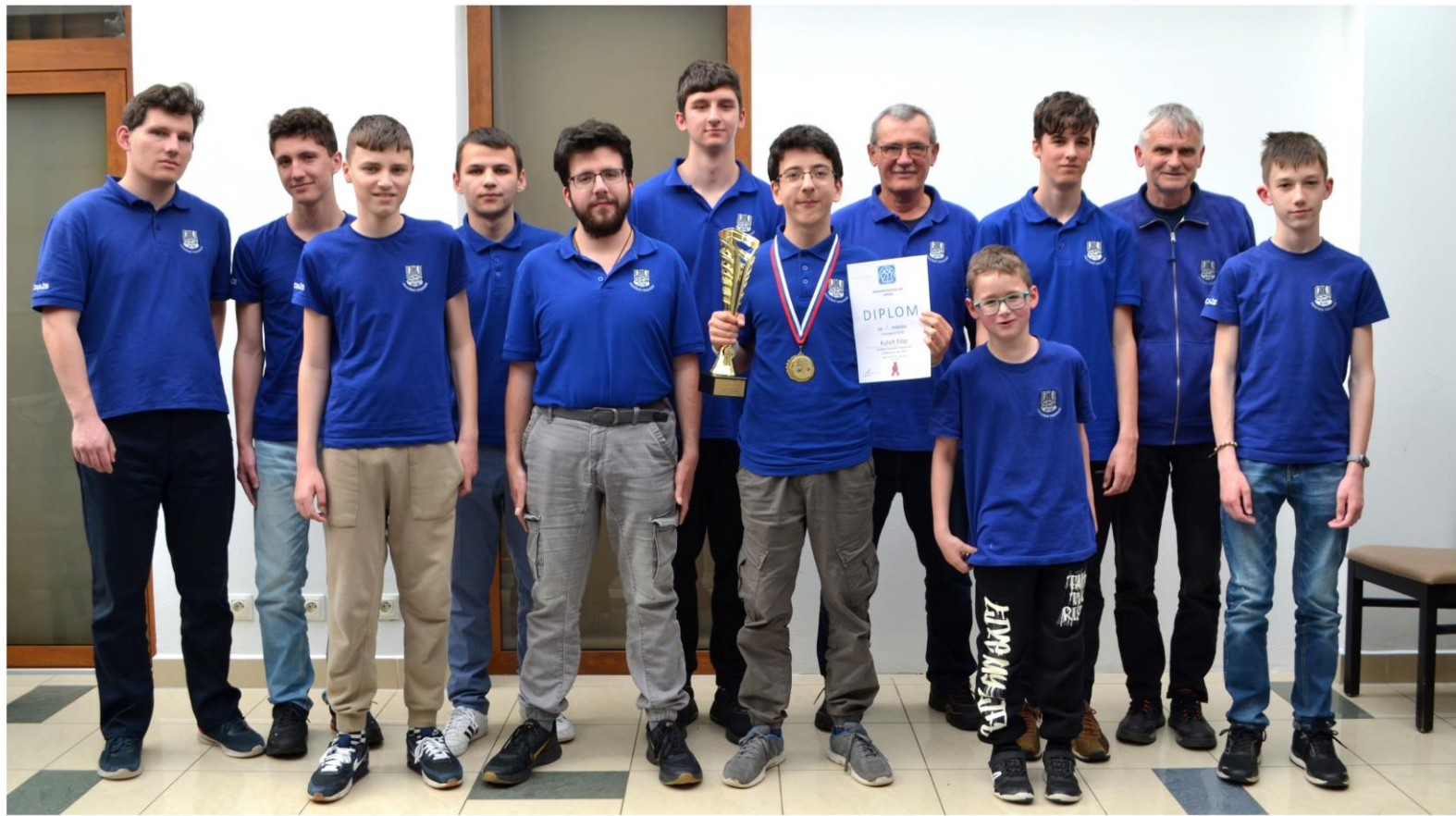
Majstrovstvá Slovenska mládeže v klasickom šachu 2025 11.-18.5.2025, Liptovský Mikuláš