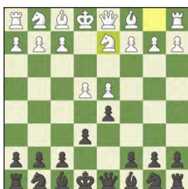
3/ Tarrasch variant 1.e4 e6 2.d4 d5 3.Jd2