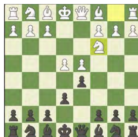
4/ Klasický variant Steinitza a McCutcheona po 3.... Jf6 alebo Winawer po 3.Sb4