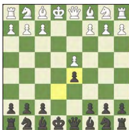
1/ Výmenný variant 1.e4 e6 2.d4 d5 3.exd5 exd5